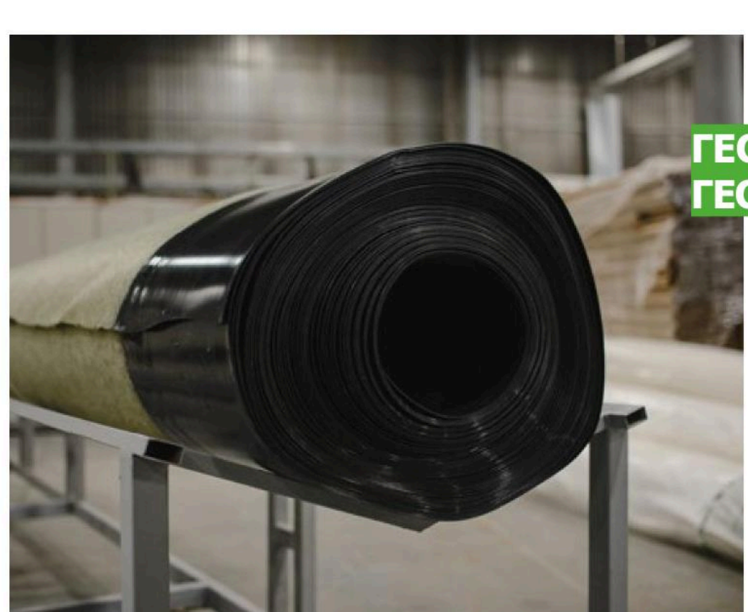
ГЕОМЕМБРАНА С ГЕОТЕКСТИЛЕМ